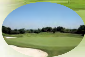
コースの手入れは入念。 美しい白砂のバンカー。

チーム総合優勝 1泊2日国内ゴルフ旅行 (2プレイ) ※飛賞には豪華賞品を 多数ご用意